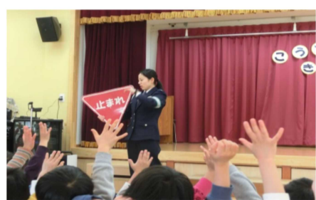
交通安全教室 & 給食試食会