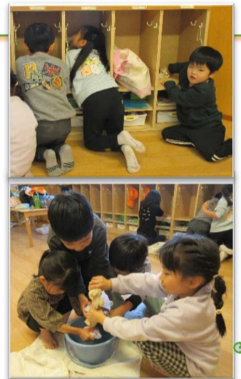
年末大掃除の様子